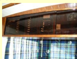
Tableau électrique avec disjoncteurs automatiques.

Carré accueillant pour quatre, convertible en couchette double 2,05m x 1,15m.